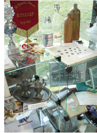
Das Beste aus 900 Jahren

ben, die Kirchen- und Schulgeschichte, die Wirtschaft und Landwirtschaft und den Roisdorfer Mineralbrunnen. Ausgestellt sind neben Bildern und Dokumenten auch Objekte wie historische Stücke aus Kirche oder Vereinen, ca. 2.000 Jahre alte römische Münzen, Produkte von Roisdorfer Unternehmen und die frisch geprägte Silbermedaille zum 900. Ortsjubiläum, das in Roisdorf vom 4. bis 6.5.2013 mit einem Festwochenende gefeiert wird.