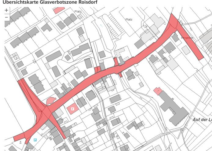
Anlage 3 zur ordnungsbehördlichen Verordnung der Stadt Bornheim über die Geltung eines Glasverbotes anlässlich der Karnevalsumzüge an „Weiberfastnacht“ und am „Karnevalssamstag“ im Bereich der Ortschaften Kardorf, Roisdorf und Waldorf vom 01.02.2018