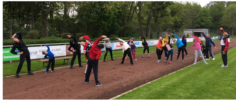
■ In der Gruppe macht Sport noch mehr Spaß.