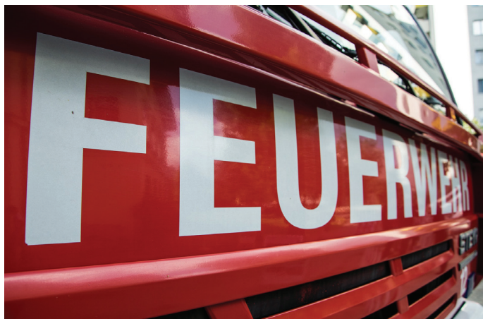
■ Ein spannender Job mit viel Verantwortung.

Wer bei der Freiwilligen Feuerwehr ist und sein Ehrenamt mit dem Beruf verbinden möchte, dem bietet die Stadt Bornheim jetzt die ideale Gelegenheit: Denn aktuell sucht die Verwaltung eine Leitung für die Abteilung Feuerschutz. Voraussetzung ist neben der Arbeit in der Feuerwehr auch eine abgeschlossene Verwaltungsausbildung. Die Abteilung trägt maßgeblich zur Einsatzfähigkeit der Freiwilligen Feuerwehren in derzeit 12 Löschgruppen mit über 300 aktiven, ehrenamtlichen Feuerwehrleuten bei. Die vielfältigen Aufgaben der Abteilungsleitung reichen dabei von der Koordination und Umsetzung der vielfältigen Maßnahmen aus dem Brandschutzbedarfsplan über Beschaffungen für die Freiwillige Feuerwehr, Aufgaben im Brandschutzbereich – zum Beispiel Erstellen und Fortschreiben von Plänen und Konzepten für den Brandschutz – bis hin zur Koordination von Ortungspunkten. Außerdem ist die Abteilungsleitung erste Ansprechstation für alle Füh-